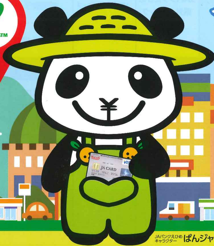
JAバンクえひめ キャラクター ぱんじゃくん