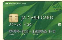
ICキャッシュカード