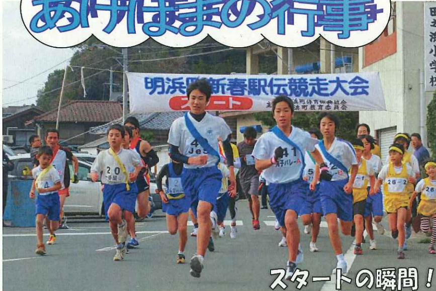
明浜町新春駅伝競走大会