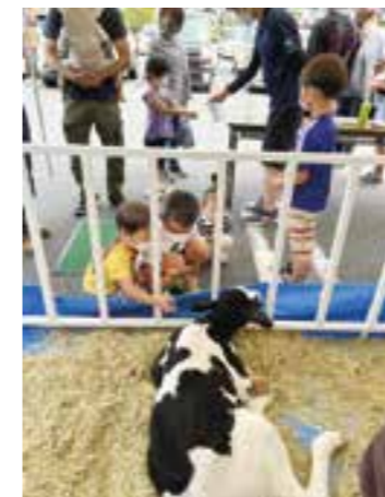
どんぶり館にて牛乳拡売運動

西予市の現在(令和5年3月末時点)の酪農家戸数は38戸、年間生乳生産量は約12,400トンになっています。(愛媛県全体 酪農家戸数:79戸 年間生乳生産量:約24,100トン)