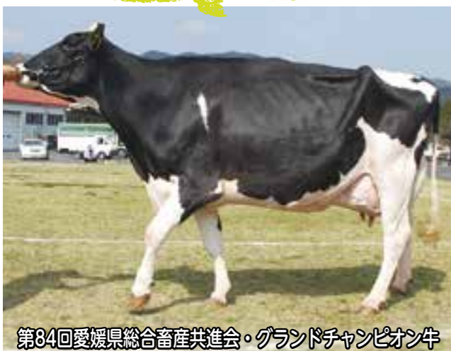
第84回愛媛県総合畜産共進会・グランドチャンピオン牛