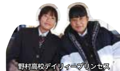
野村高校デイリープリンセス

年に一度の東宇和一番の美牛コンテスト。今回の大会は、コロナ禍の影響で4年ぶりの大会。7部門に39頭が参加しました。