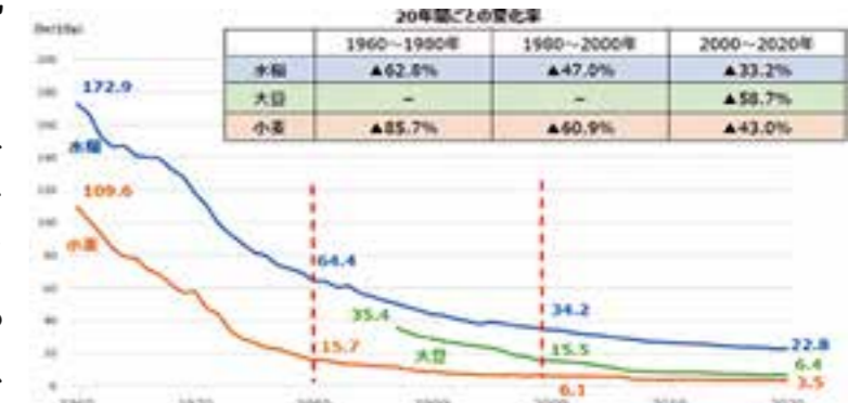
日本の水稲・小麦・大豆の10aあたりの労働時間の推移(全国平均)

資料:農林水産省「農業経営統計調査」 注:1994年産までは直接労働時間、1995年産以降は直接労働時間と間接労働時間の合計。