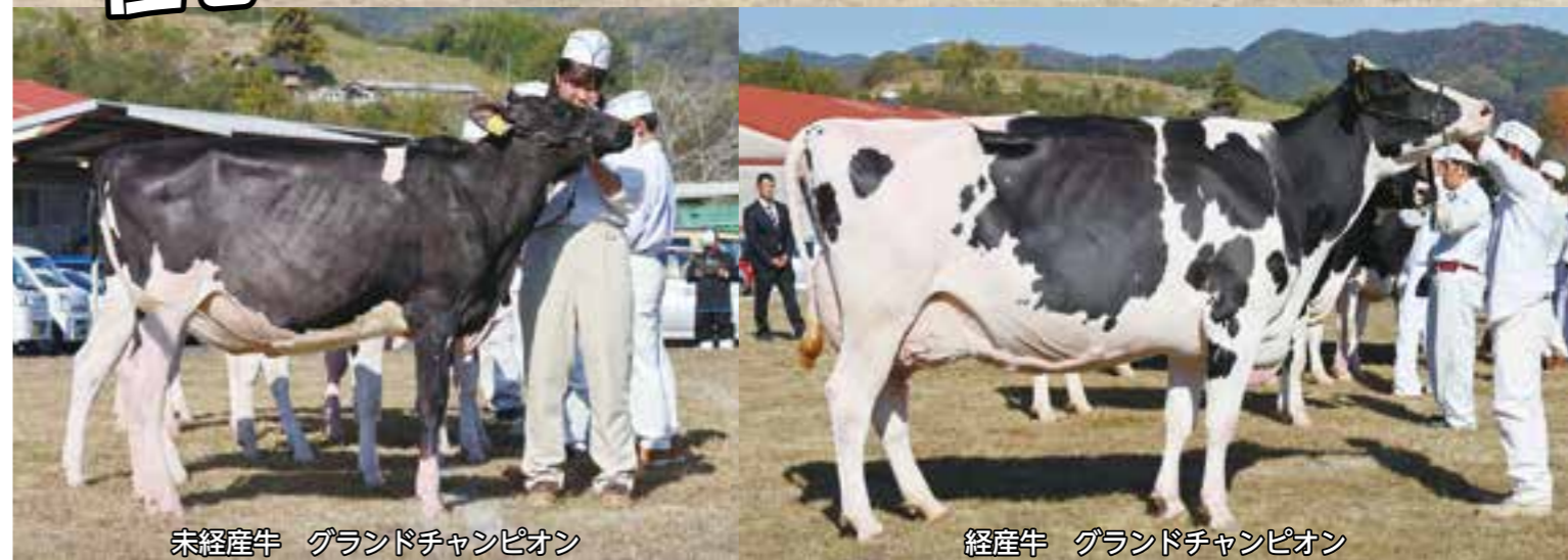
未經産牛 グランドチャンピオン