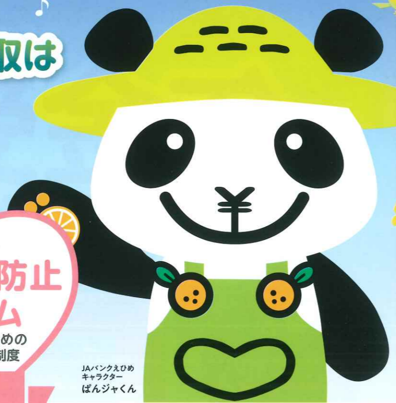
JAバンクえひめ キャラクター ばんじゃくん