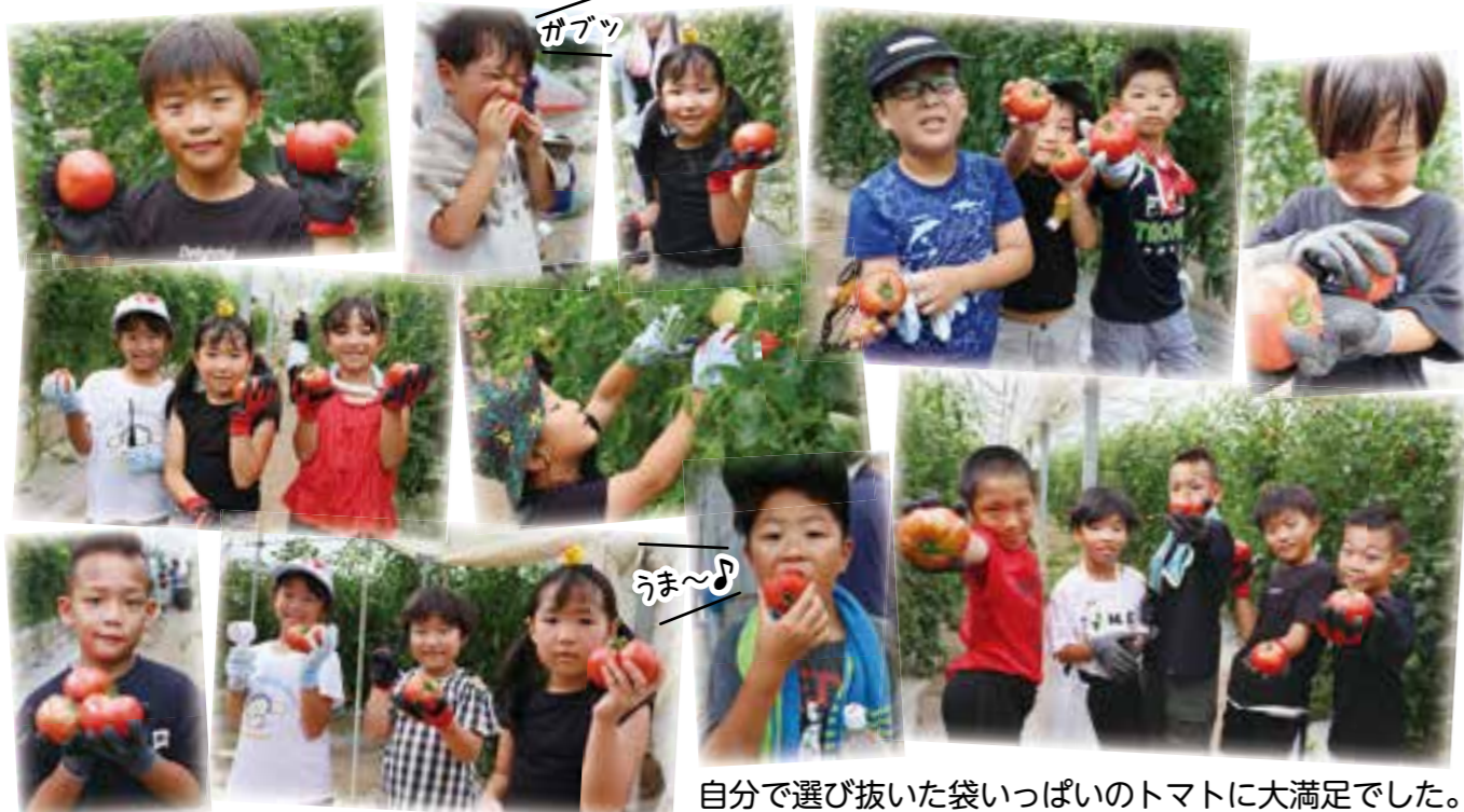
自分で選び抜いた袋いっぱいのトマトに大満足でした。