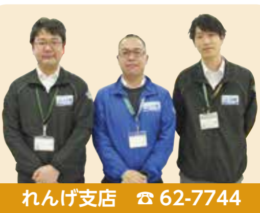
れんげ支店 ☎ 62-7744