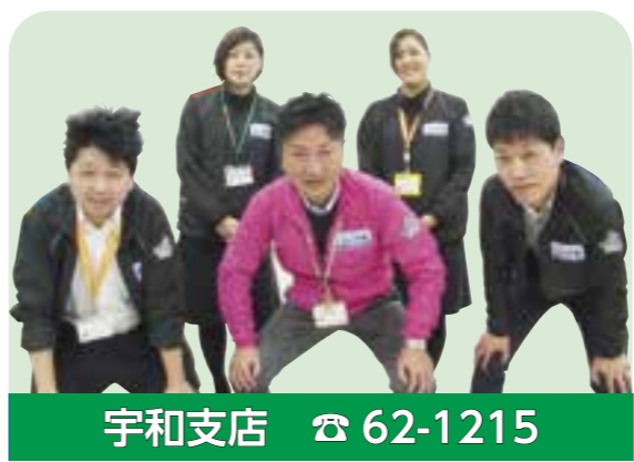
宇和支店 ☎ 62-1215

L A（ライフアドバイザー）がみなさまの保障点検にうかがいます。 L Aとは保険や共済などみなさまの生活をより良くする専門の渉外担当です。