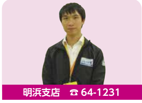
明浜支店 ☎ 64-1231