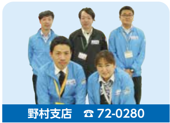
野村支店 ☎ 72-0280