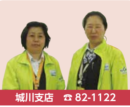
城川支店 ☎ 82-1122